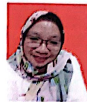
HUSRIANA KASI PELAYANAN